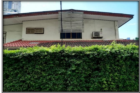
ด้านทิศตะวันออกของโครงการ : ติดกับบ้านพัก