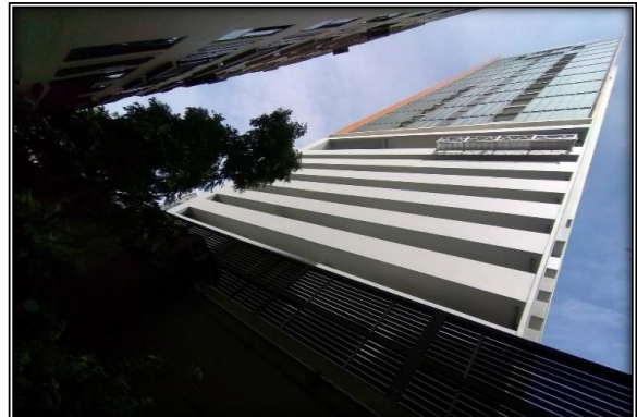
ด้านทิศตะวันออกของโครงการ : ติดกับบ้านพัก