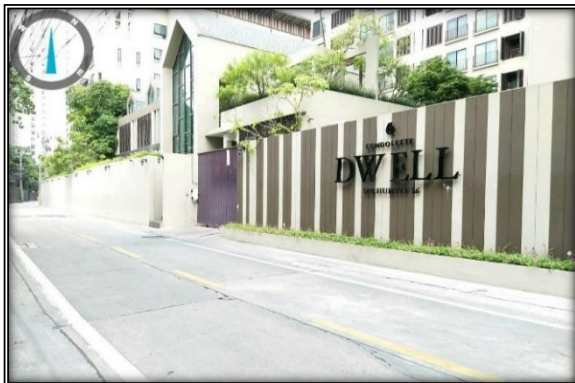
ด้านทิศเหนือของโครงการ : ติดบ้านพักอาศัย